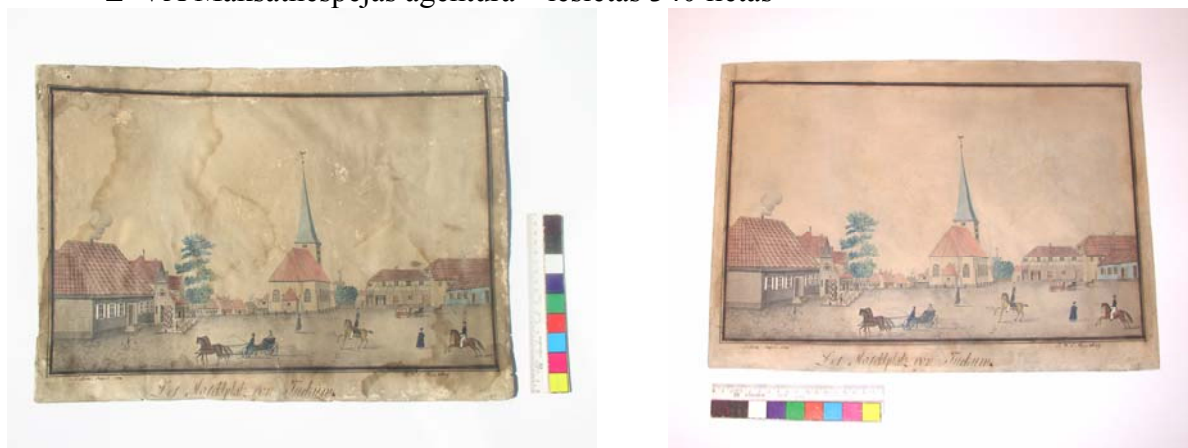
3. att. Tukuma muzeja akvarelis pirms un pēc restaurācijas

Realizēti arī vairāki sadarbības līgumi, kuru ietveros veikta bez maksas dokumentu restaurācija un konservācija - Tautas frontes muzejam – restaurēti 5 plakāti un izgatavotas nestandarta kārbas LFT muzeja gleznu eksponēšanas vajadzībām.