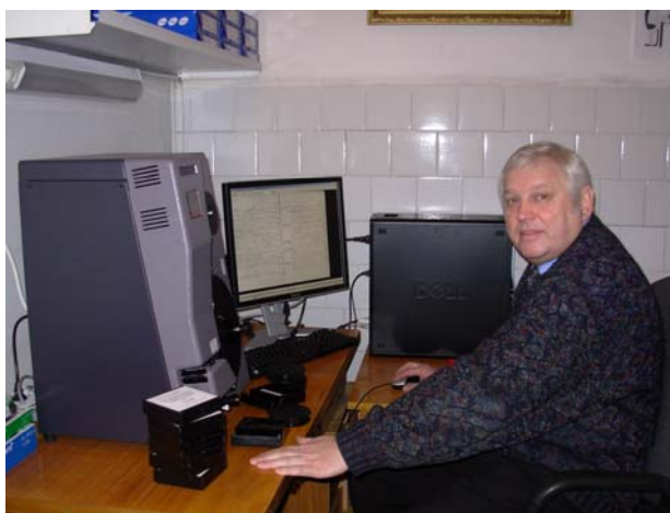
4.att. Mikrofilmu digitalizēšanas iekārta OMI200

Lai nodrošinātu projekta publicitāti sagatavots raksts “Top arhīvu projekts “Raduraksti”: Arvien vairāk Latvijas iedzīvotāju interesējas par savas ģimenes vēsturi”. Tas publicēts Latvijas Avīzes 2006. gada 4.decembra Nr. 328. rubrikā Kultūrzīmes.