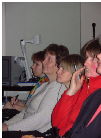
6. att. Laboratorijas speciālisti piedalās seminārā “Kolekcijas saglabāšana: pasīvais un aktīvais risinājums”

2006. gadā Laboratorijā pirmo reizi organizēta arī speciāla ekskursija skolēniem, lai iepazīstinātu tos ar resturatoru darbu. Ekskursijā piedalījās Rīgas 99.vidusskolas sesto klašu 43 skolēni. Šī darba turpināšanai nepieciešamas izstrādāt speciālu mācību prgrammu un uzskates līdzekļus.