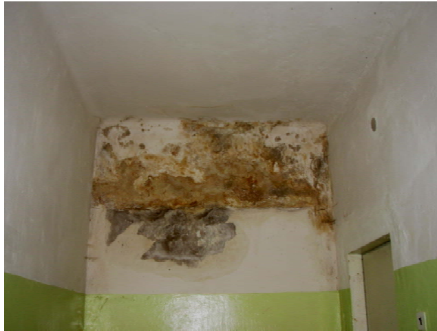
5. att. Siena Tukuma ZVA Saldus sektora 1. stāva glabātavā

2006. gadā Ģenerāldirekcijas organizēto arhīva darba komplekso pārbaūžu ietvaros veiktas dokumentu saglabāšanas apstākļu pārbaudes un sagatavotas izziņas par dokumentu saglabāšanas nodrošināšanu Liepājas un Tukuma zonālajā valsts arhīvā. Pārbaūžu rezultāti rāda, ka arhīvi cenšas izpildīt iepriekšējās pārbaudēs dotos norādījumus atbilstoši tiem piešķirtajiem finasnu resursiem. Diemžēl abos šajos arhīvos jau ilgstoši ir problēmas ar glabātavu vides nodrošināšanu – arhīvu ēkās ir brants, kuras novēršanai nepieciešams veikt speciālus pasākumus, kas saistīt ar ievērojamiem finansu līdzekļiem.