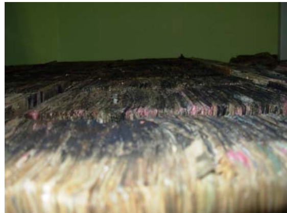
2. att. Republikāniskā adrešu biroja pieraksta – izraksta lapiņas pirms apstrādes